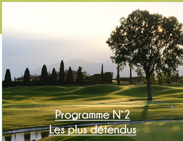
Programme N°2 Les plus détendus

Le parcours est un PAR 72 de 5943 mètres.