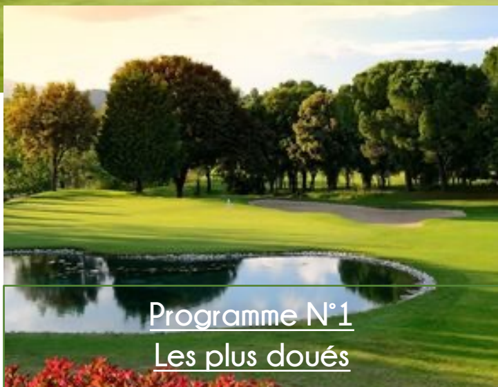
Programme N°1 Les plus doués